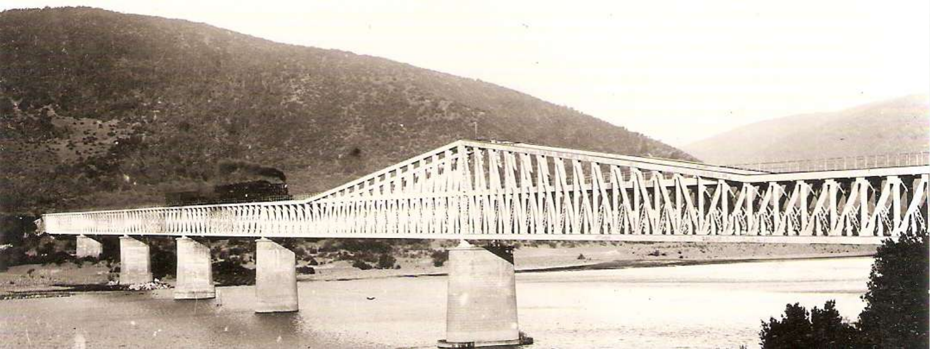
Locomotora a vapor, Puente Banco de Arena.

Hasta 1915, las locomotoras a vapor del tipo Tenders, se desplazaban con entera libertad entre las estaciones y parajes de Talca, Colín, Rauquén Corinto, El Morro, Curtiduría, Infernillo, Tanguao, Pichamán, El Álamo, Huinganes, Maquegua y Rancho Astillero. Las locomotoras eran capaces de arrastrar un peso de 200 toneladas entre coches de pasajeros, de primera clase, de segunda clase y de tercera clase con treinta asientos cada uno, montados sobre sillas de acuerdo al estilo norteamericano, con un peso no superior a las cuatro toneladas; también arrastraba