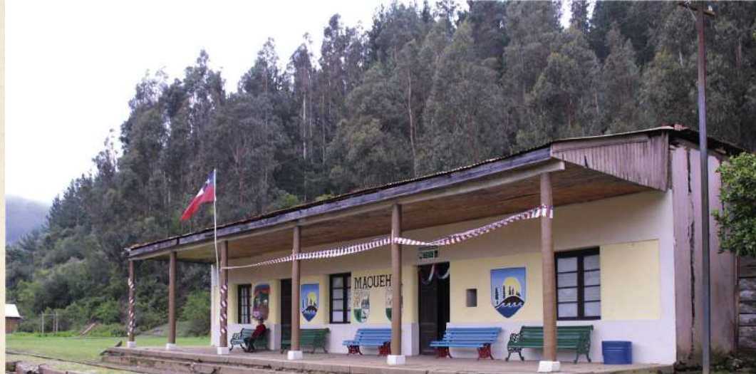
Antigua Estación de Maquehua.

“...Como anécdota, recuerdo que yo cuando me fui a trabajar a la escuela de Maquehua, caminaba de Carrizal a Cañete a pie, por entremedio de un bosque de Forel a Carrizalillo, 11 kilómetros. Después, salíamos a caballo para poder tomar el tren...”