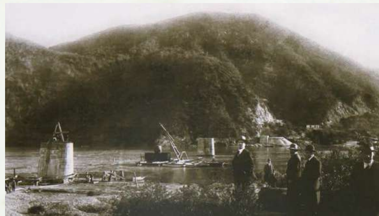
Construcción del Puente Banco de Arena.

La navegación del río Maule fue durante siglos la vía de conexión de la región con el exterior y por lo tanto el medio más expedito para impulsar el crecimiento económico y social del territorio. En torno a la navegación, armadores, marineros y comerciantes desarrollaron una intensa actividad económica, caracterizada por los astilleros maulinos donde se construían bergantines, goletas y balandras utilizando pellín, roble, alerce, ciprés, coigüe, luma y araucaria. Este movimiento marítimo posibilitó que en 1828 Constitución fuese declarado “Puerto Mayor” de la República de Chile.