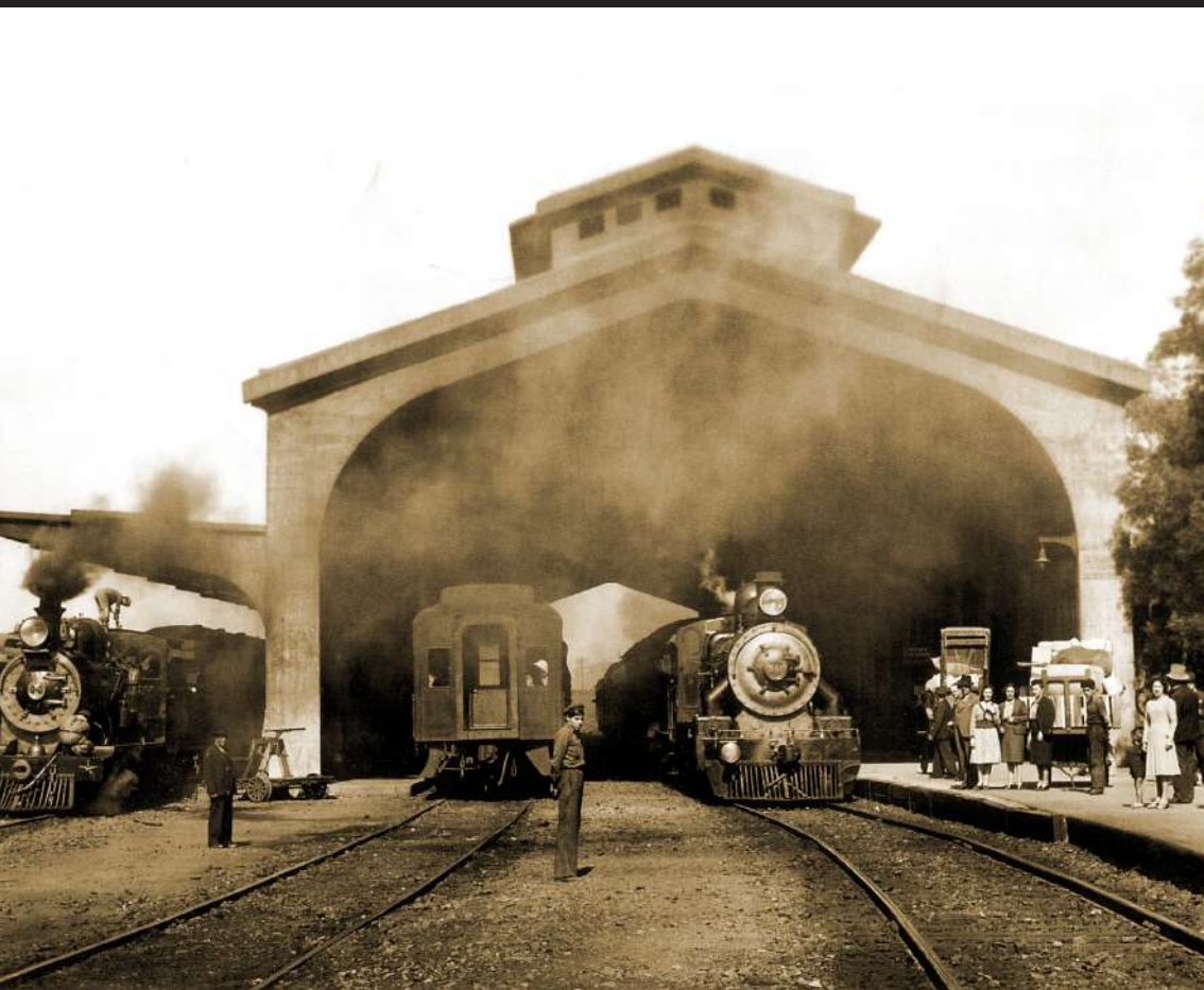
Estación de Talca, principios de siglo XX, Colección MOBAT.